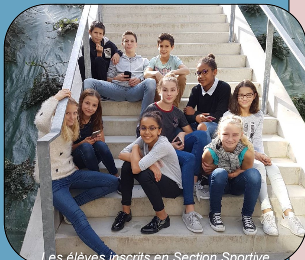
Les élèves inscrits en Section Sportive Gymnastique cette année